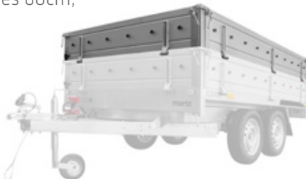
6 steel extensions 30cm, Stahlbordwandaufsatz 30cm, réhausse de ridelles en acier 30cm, burty BIS stal 30cm