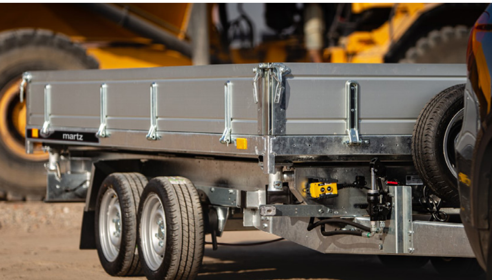
kipper 360/2 C

3-side tipping (320/2 C, 360/2 C, 400/3 C) • 3-Seite Kippen (320/2 C, 360/2 C, 400/3 C) tribenne à partir du modèle (320/2 C, 360/2 C, 400/3 C) • uchył na trzy strony (320/2 C, 360/2 C, 400/3 C)