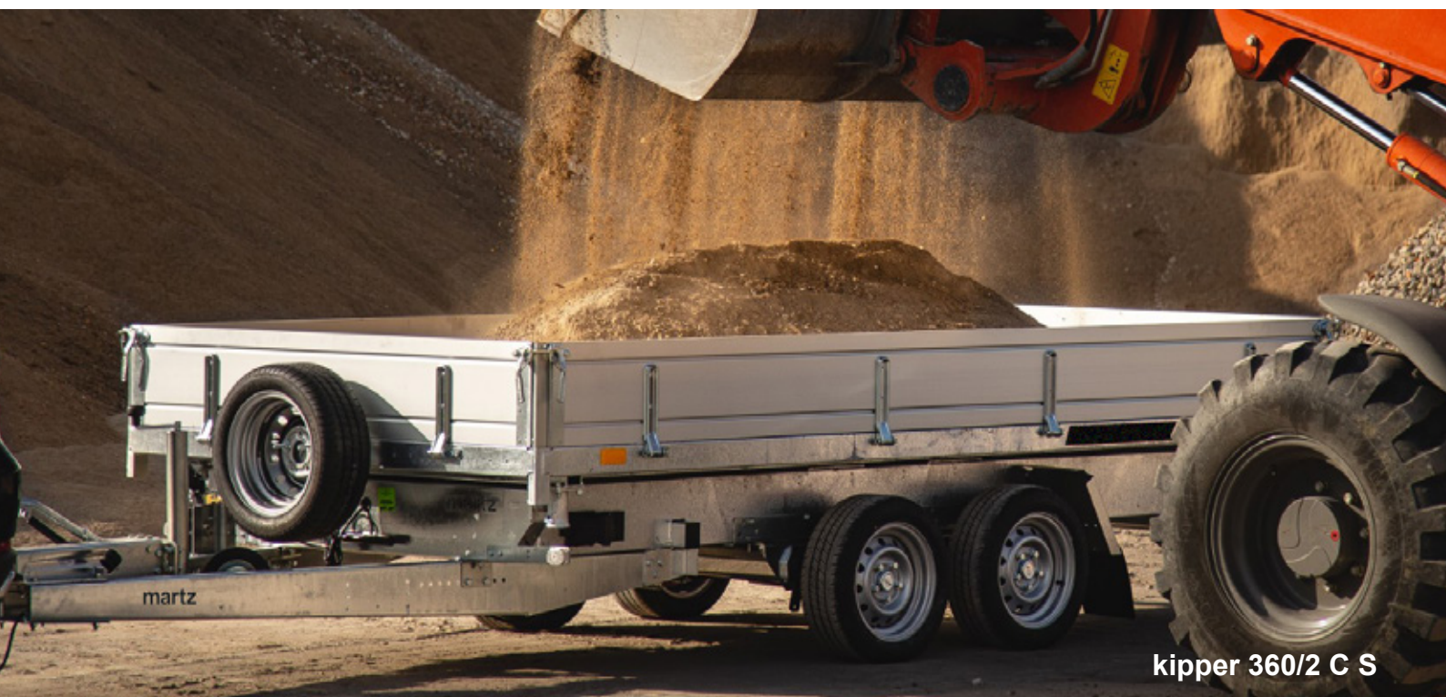
kipper 360/2 C S