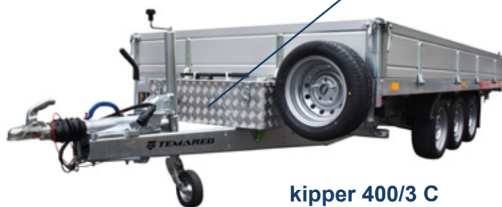
kipper 400/3 C

3-side tipping (320/2 C, 360/2 C, 400/3 C) • 3-Seite Kippen (320/2 C, 360/2 C, 400/3 C) tribenne à partir du modèle (320/2 C, 360/2 C, 400/3 C) • uchył na trzy strony (320/2 C, 360/2 C, 400/3 C)