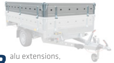
3 alu extensions, Alubordwandaufsatz, réhausse de ridelles en alu, burty ALU BIS