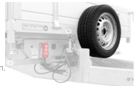
8 spare wheel, Ersatzrad, roue de secours, koło zapasowe