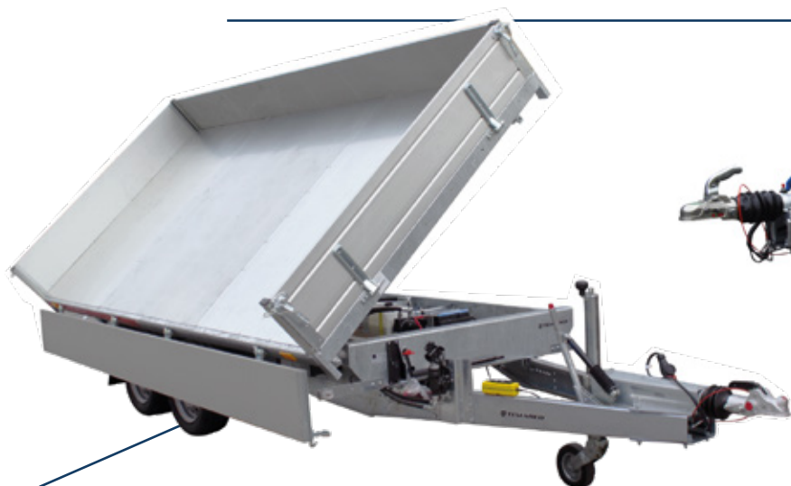
kipper 360/2 C