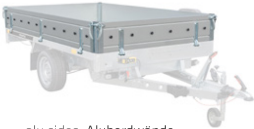
1 alu sides, Alubordwände, ridelles en alu, burty ALU