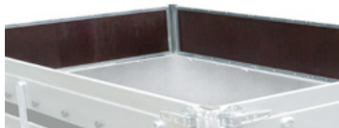
7 plywood infill, Bordwände mit der Siebdruckausfüllung, remplissage des ridelles en bois, wypełnienie burt sklejką