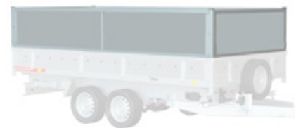
5 steel welded extensions 60 cm, geschweißte Stahl Aufsatzbordwände 60 cm, réhausse de ridelles soudées en acier 60cm, Burty BIS stalowe spawane pełne 60 cm