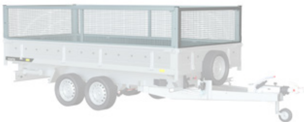
4 mesh welded steel extensions 60 cm geschweißter Stahl-Gitteraufsatz 60 cm, réhausse de ridelles grillagées soudées 60cm, burty BIS siatkowe spawane 60 cm